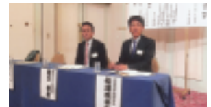
◆5月11日：第4ブロック総会を開催◆