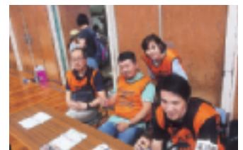
“税金クイズをやってま～す”