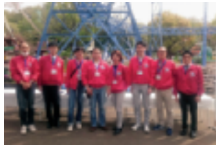
応援頂いた皆様（中野）