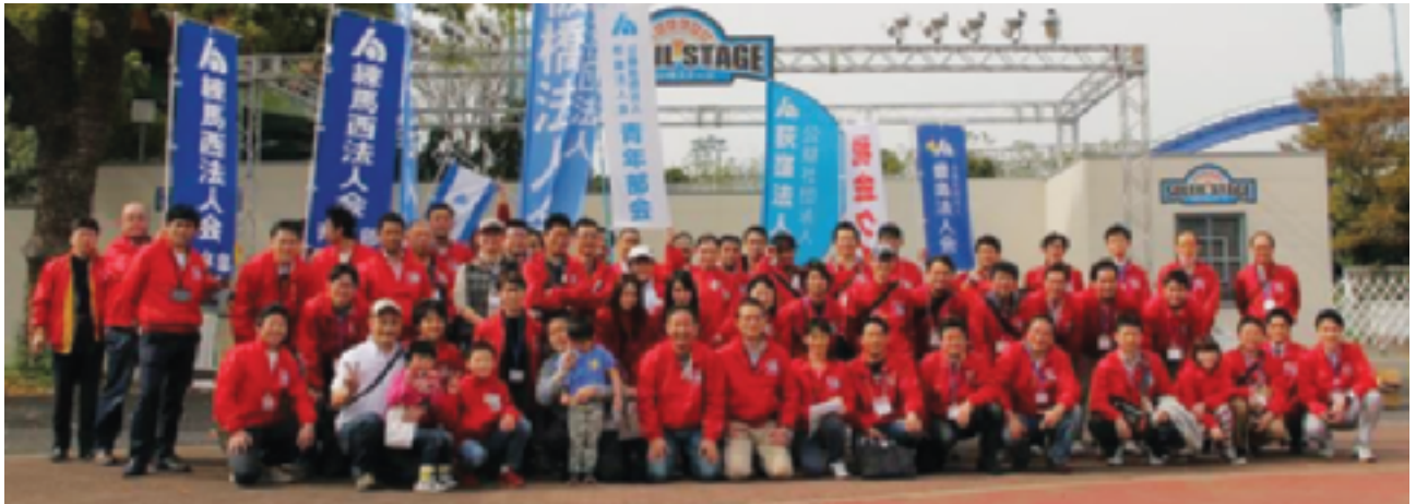
応援頂いた第4ブロックの皆様