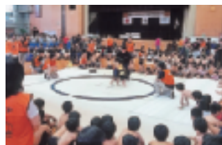
“のこったのこった”