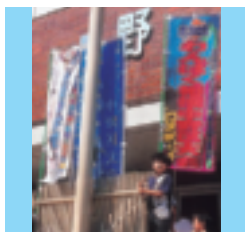
会場の中野体育館