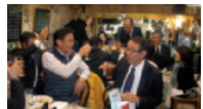
終了後の懇親会で…

中野法人会は毎年「講師養成研修」を行っている事もあり、講師の候補者は、大勢いますが、それでも改めて