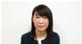
挨拶:金高副署長様