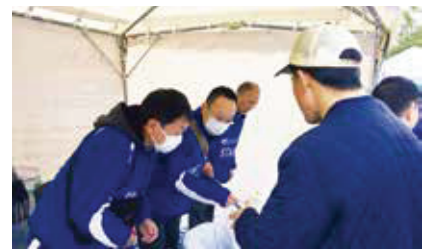
～ ゴミの分別はしっかりとネ ～