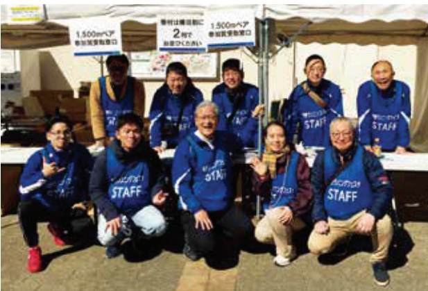
～～～～～～～～～ ボランティアスタッフに参加された皆様、お疲れ様でした!! ～～～～～～～～～