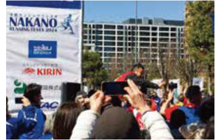
ランフェスを盛り上げて頂きました!