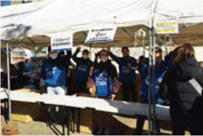
～ 法人会は“受付”の担当です ～