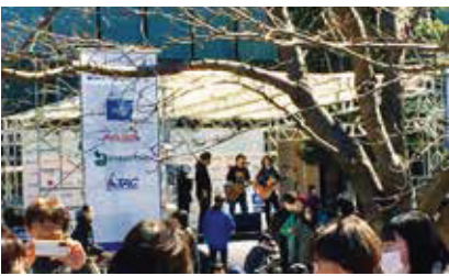
～～～～～ ステージでは様々なイベントが… ～～～～～