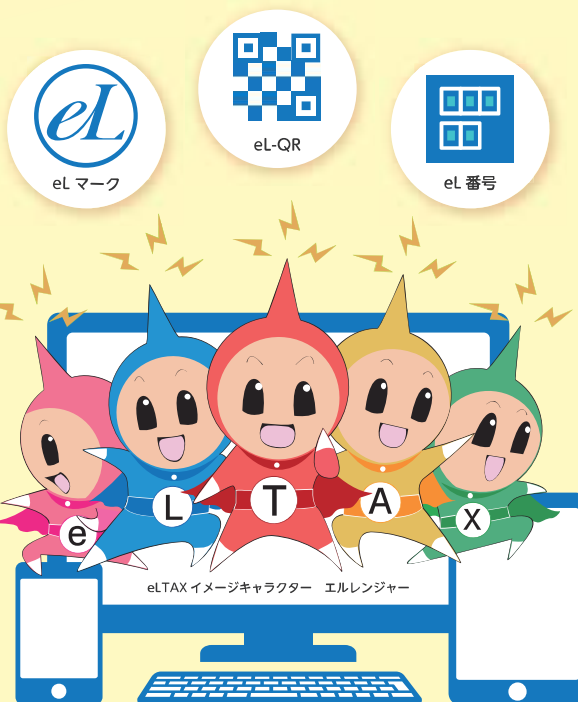
eLTAX イメージキャラクター エルレンジャー