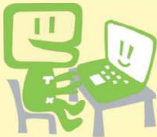
国税庁 e-Tax キャラクター イータ君