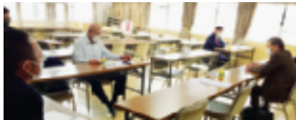
3月10日 税制税務委員会