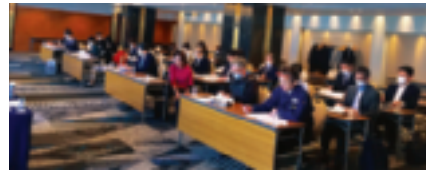
3月14日 厚生共益・公益事業委員会