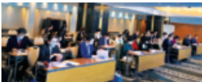
3月14日 厚生共益・公益事業委員会