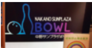
会場のサンプラザボウル