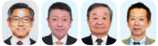
横山会長 柴野公益事業委員長 大月税制税務委員長 宮治厚生共益事業委員長