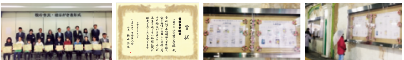
～ ～ ～ ～ 12月8日:表彰式 ～ ～ ～ ～