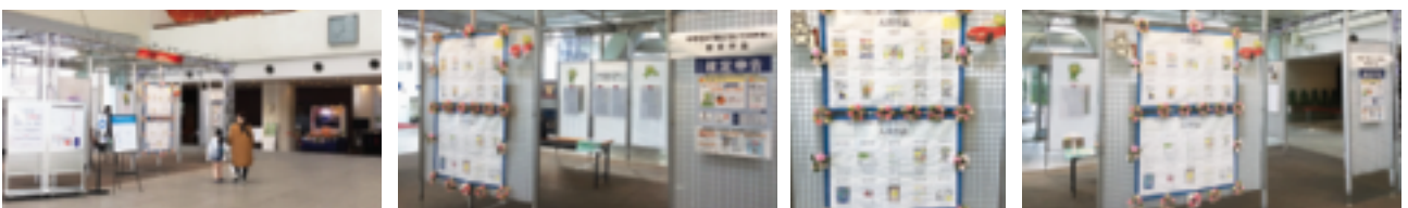
～ ～ ～ ～ ～ ～ 2月7日～2月14日 中野サンプラザ1階 イベントスペース ～ ～ ～ ～ ～ ～