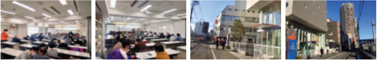
12月16日 初心者向け「スマートフォン・LINE」講座(於:専門学校テクニカルカレッジ) (山手通り方面から)会場のテクニカルカレッジ(旧・日本閣方面から)