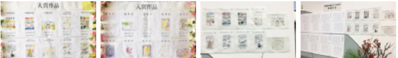
～ ～ ～ ～ 常設展示(法人会館) ～ ～ ～ ～