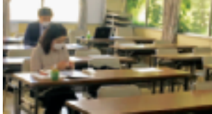
5月14日 会場参加の方