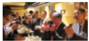
～～～ 12月7日（於：月忠） ～～～