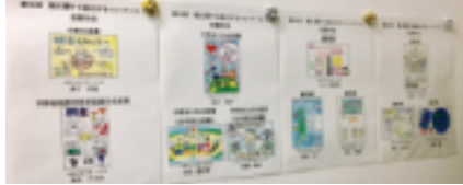
(於：西武信用金庫中野北口支店)