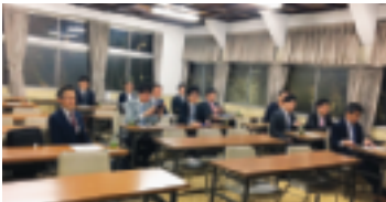
12月7日 参加された皆様全員が講師候補です

12月7日、「第522回研修会」が法人会館で行なわれました。講師に、渋谷税務署広報公聴官・齊藤氏を招